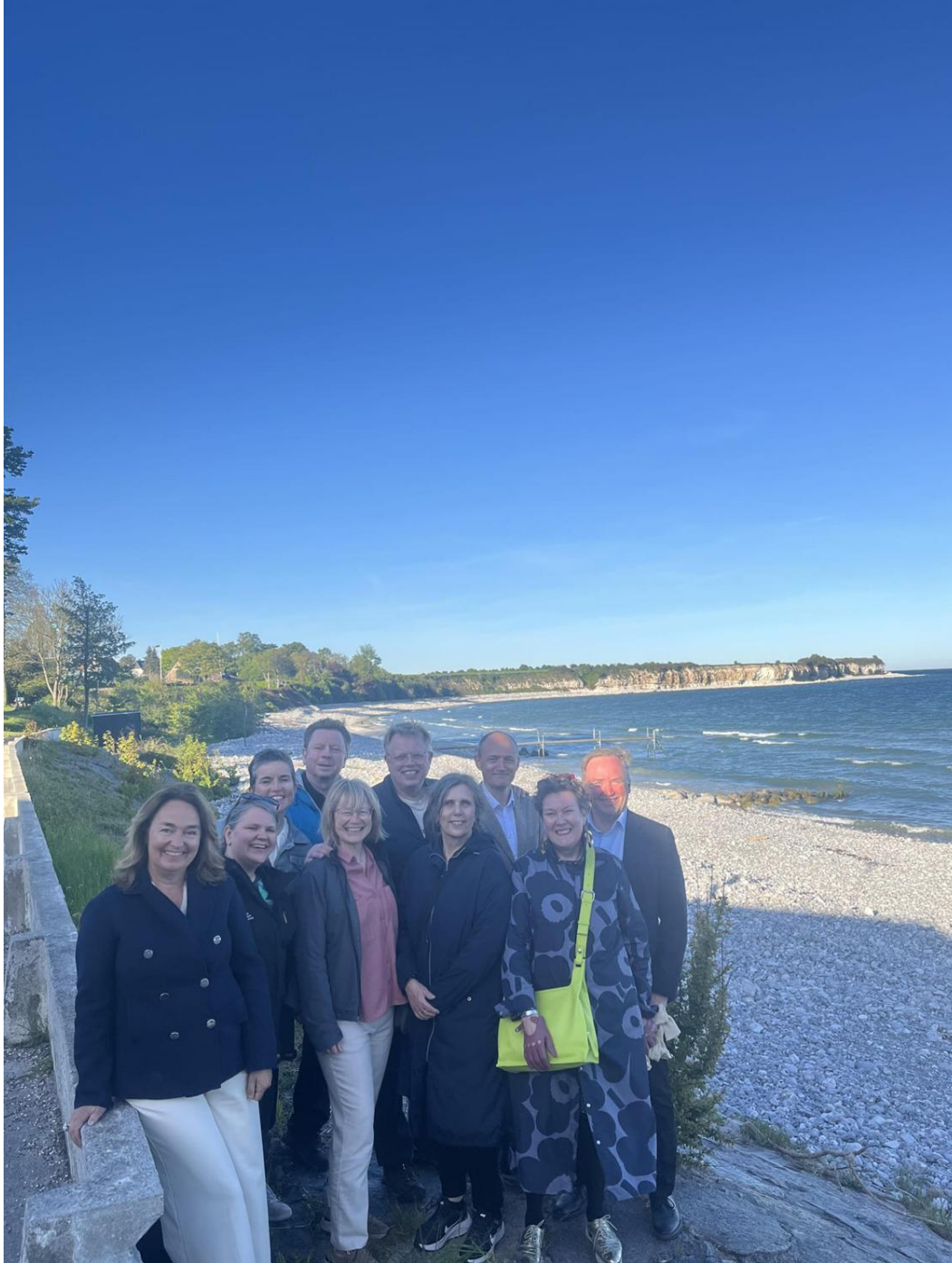
Pohjoismaisen maailmanperintöyhdistyksen vuosikokous Tanskan Stevns Klintissä