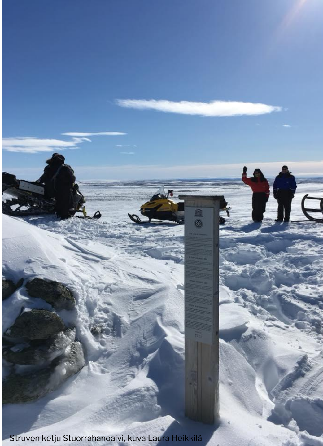
Struven ketju Stuurrahanoaivi