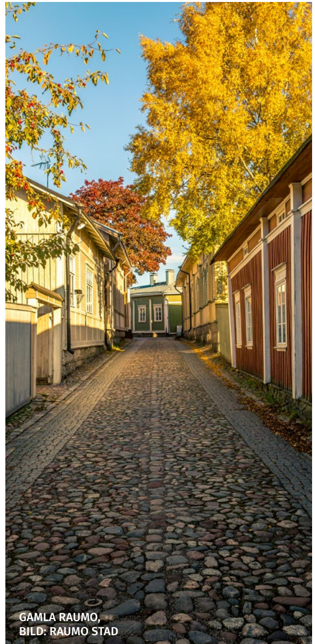
GAMLA RAUMO