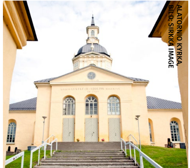
ALATORNIO KYRKA

Struves meridianbåge sträcker sig från Norra ishavets strand till Svarta havet och är 2 820 kilometer lång. Hela kedjan består av 34 mätpunkter, 258 bastrianglar samt 265 baspunkter och går igenom tio länder (Norge, Sverige, Finland, Ryssland, Estland, Lettland, Litauen, Vitryssland, Moldavien, Ukraina). Struves meridianbåge som går över flera statsgränser är det första världsarvet, som sträcker sig över så här många länder.